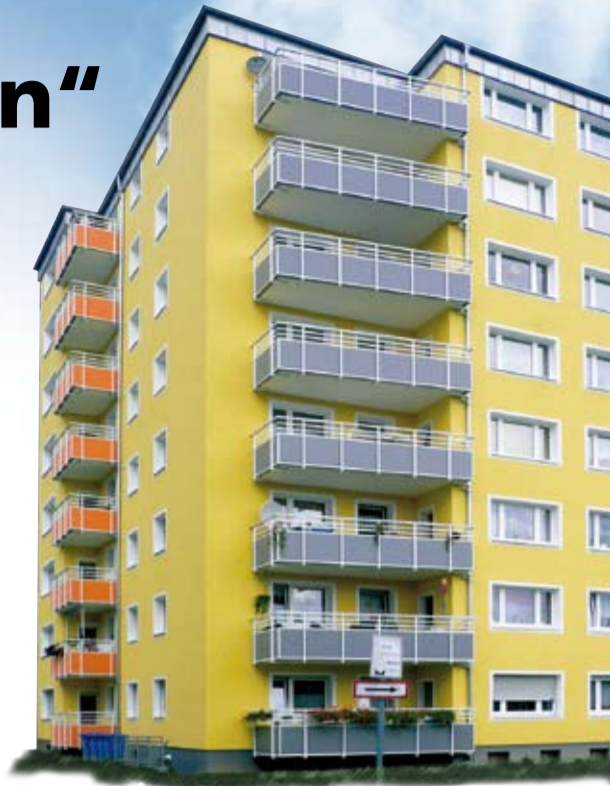
Schützende Siliconharzfarben in attraktiven Farben, im Nespritec-Verfahren aufgespritzt, setzen Akzente an der Fassade, und die von Hand bemalten Balkone sind wahre Blickfänge.

Als etwas schwieriger und besonders zeitintensiv erwies sich die Sanierung der Balkone, da hier der Estrich allerorten herausbröckelte. Die Sichtschutzplatten an den