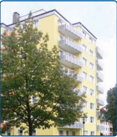
Wärmedämmende Dalmatiner-Fassadenplatten „unter der Haut“: das sanierte Hochhaus in Mettmann.

Hitze und Frost müssen die Bewohner eines achtgeschossigen Hochhauses in der Berliner Straße in Mettmann fortan nicht mehr fürchten. Mit gut 15.000 der von Caparol neu entwickelten „Dalmatiner-Fassadenplatten“ wurde das Gebäude gedämmt, teilsaniert und farblich gestaltet.