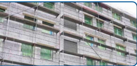
Zunächst wurde eine wirksame Wärmedämmung aufgebracht, bevor das mehrgeschossige Wohnhaus in Mönchengladbach mit den Meldorfer Flach- und Eckverblendern aufgewertet wurde.

Meldorfer Flachverblender sieht man an Hausfassaden immer häufiger. Mit ihnen lassen sich Fassaden individuell gestalten und natürlich vor Witte-